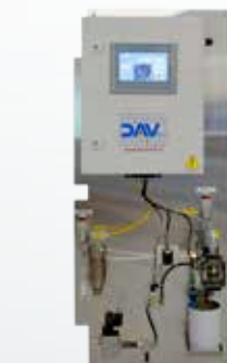
SISTEMA DI RILEVAZIONE E SPURGO BOLLE D'ARIA AIR BUBBLES DETECTION AND PURGING SYSTEM