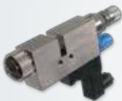
DAS 100 EV