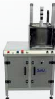
SISTEMA DEGASSAGGIO OLIO E GRASSO GREASE DEGASSING SYSTEM