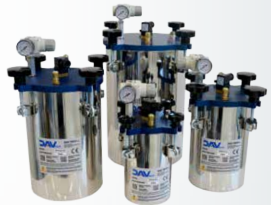
SERBATOI • PRESSURIZED TANKS