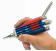
DAV 100-200 MAN