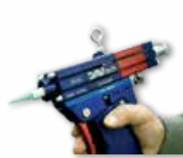
DAV 300-400 MAN