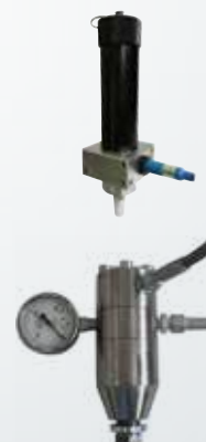
PORTA CARTUCCE PRESSURIZED CARTRIDGE HOLDER